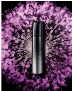
B.A. ミルク フォーム