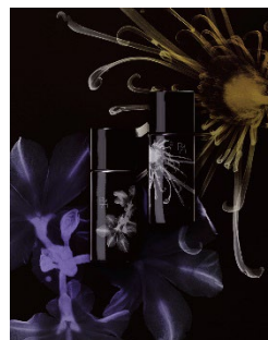
B.A. リキッド ファンデーション