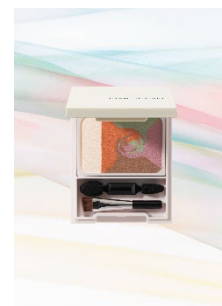
ディエム クルール カラーブレンド アイブローマルチパレット