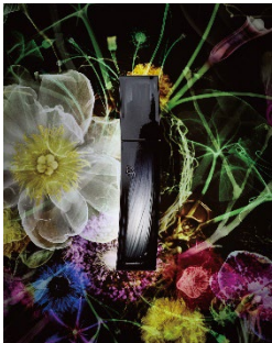
B.A. ローション イマース