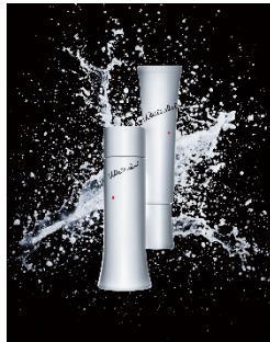
ホワイトショット LX ホワイトショット MX