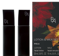
・ B.A ローション 20mL ・ B.A ミルク 15mL

全国のポーラ エステお取り扱いショップ（限定店舗のみ）、旗艦店「ポーラ ギンザ」にて展開します。百貨店や海外でのお取り扱いはございません。