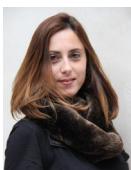
デザイナー Giulia Pigafetta (ジュリア・ピガフェッタ)

1981年イタリア・バドバ生まれ。学生時代はモデルとして活躍。アパレルブランドのデザインアドバイザーとして活躍後、独立。