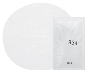
APクレイマスク834 (クレイマスク) ¥3,850 (税抜¥3,500) 0716