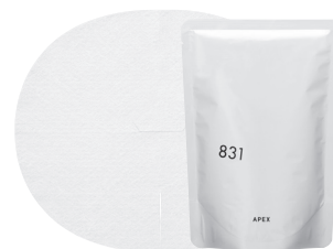
AP石こうマスク831 (温感石こうマスク) ¥3,850 (税抜¥3,500) 0713