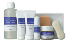
AUGHA MDパウダー ¥4,840 (税抜¥4,400) 2328