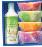
バスセクション1000 ¥1,100 (税抜¥1,000) 5125