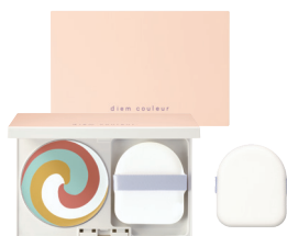
カラーブレンド グローファンデーションN (パフ付き) リフィル ¥5,830 (税抜¥5,300)