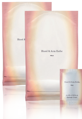
ハンド&アームエステ セット ¥1,650 (税抜¥1,500) 2184