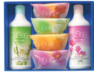
バスセクション1500 ¥1,650 (税抜¥1,500) 5126