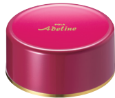
アデリーヌ ダスティングパウダー ローズアコード ¥3,190 (税抜¥2,900) 0452