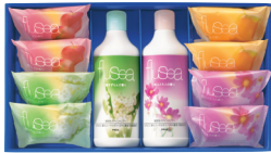
バスセクション2000 ¥2,200 (税抜¥2,000) 5127