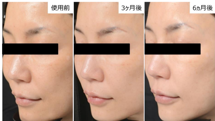
図2. 安全性確認を主目的とした長期使用試験での代表例 「全体のトーンが明るくなり、くすみが取れてきた気がする。頬のシミも薄くなった。」(使用中アンケートでのコメントより)