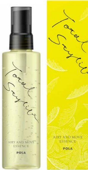
トータルスタイリフト エアリーアンドムーブ エッセンス ＜スタイリング・美容液＞ 150g ￥2,300（税込￥2,484） （美容サロン専売品）

株式会社ポーラ（本社：東京都品川区、社長：鈴木弘樹）は、エアリーヘアが軽やかにキマるスタイリング・美容液『トータルスタイリフト エアリーアンドムーブ エッセンス』（150g、￥2,300＜税込￥2,484＞）を2014年8月25日に美容サロンにて発売します。