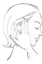
③あごラインの引き上げ