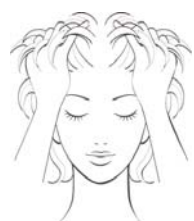
②頭皮全体の引き上げ