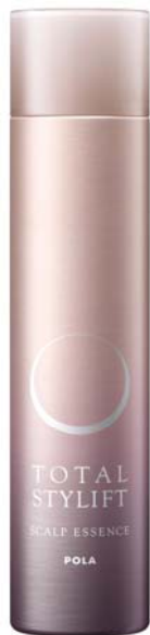
トータルスタイリフト スキャルプ エッセンス 100g 税込¥2,940 (美容サロン店販用)