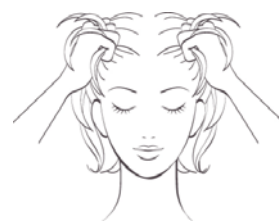
⑤足頭部の引き上げ

首を傾け、生え際に4本指を当てて、ストレッチしながら引き上げる。 (×5回×左右)