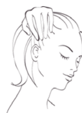
④生え際の引き上げ

首を傾け、生え際に4本指を当てて、ストレッチしながら引き上げる。 (×5回×左右)