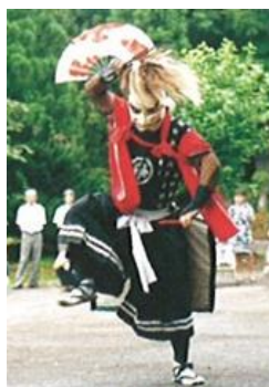
岩崎鬼剣舞保存会 【岩手県】

1975年石川県生まれ。1997年石川県九谷焼技術研究所卒業。2000年伝統九谷焼工芸展技術賞(2005年、2009年)、2010年全国伝統工芸品公募展経済産業省製造産業局長賞受賞。2011年「REVALUE NIPPON PROJECT—中田英寿 現代陶芸と出会う—」(茨城県陶芸美術館)、2012年「工芸未来派」(金沢21世紀美術館)、2014年パラミタ陶芸大賞展大賞(パラミタミュージアム)、2015年度石川デザイン賞受賞、2019年伝統文化ポーラ賞奨励賞受賞。