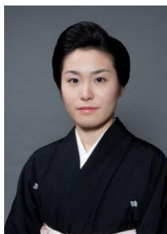
井上 安寿子 (いのうえ やすこ)

1947年石川県生まれ。金沢美術工芸大学卒業。1974年より高橋介州に師事。1979年日本伝統工芸展初入選。1988年日本伝統工芸展「朝日新聞社賞」受賞。1996年金沢美術工芸大学教授。2004年伝統文化ポーラ賞優秀賞受賞、重要無形文化財「彫金」保持者認定。2006年東京三越本店初個展。2008年メトロポリタン美術館に作品収蔵。2009年「紫綬褒章」受章。2010年大英博物館に作品収蔵。記録映画「加賀象嵌 中川衛 美の世界—新たな伝統を創る—」(ポーラ伝統文化振興財団企画、2011年)。