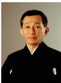
観世 清和 (かんぜ きよかず)