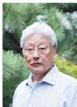
中川 衛 (なかがわ まもる)

1959年東京生まれ。父は25世宗家 観世左近元正。1990年家元継承。室町時代の観阿弥、世阿弥の子孫二十六世宗家として、現代の能楽界を牽引する。1995年度芸術選奨文部大臣新人賞受賞。1999年フランス文化芸術勲章シュバリエ受章。2012年度芸術選奨文部科学大臣賞受賞。2013年伝統文化ポーラ賞大賞受賞。2015年「紫綬褒章」受章。2019年度JXTG音楽賞受賞。重要無形文化財総合認定保持者。