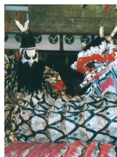
有福神楽保持者会 【島根県】

北上和賀地方に伝わる鬼剣舞の源流。大宝年間(701~704年)、修験の祖である役行者(小角)が念仏を唱えながら踊ったことに始まるとされる。いわゆる「念仏剣舞」の一種であるが、威嚇的な鬼のような面をつけ勇壮に踊るところから、「鬼剣舞」と呼ばれる。国指定重要無形民俗文化財。記録映画「みちのくの鬼たち—鬼剣舞の里—」(ポーラ伝統文化振興財団企画、1996年)。