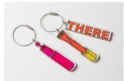
ポーラ ミュージアム アネックス限定品