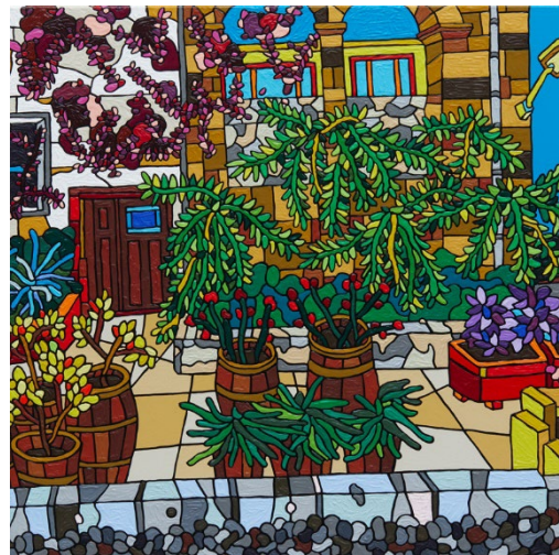
左: 「DHL」 2022, Acrylic on Canvas, 20 x 20 x 5.5cm 右: 「BEDUA」 2024, Acrylic on Canvas, 70 x 70 x 6.5cm