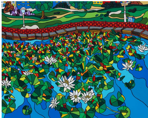
左: 「A14」 2023, Acrylic on Canvas, 24 x 18 x 5.5cm 右: 「Weinsbergspark, Berlin」 2023, Acrylic on Canvas, 80 x 100 x 4.5cm