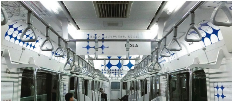
POLA Dots Train 広告掲出期間：2016年10月17日～2016年11月1日

尚、受賞作品は、8月22日～8月23日（10：00～17：30）、サピアタワー ステーションコンファレンス東京5Fにて展示されます。また、「交通広告グランプリ」公式サイト（ http://awards.jeki.co.jp/ ）内にてご覧いただけます。