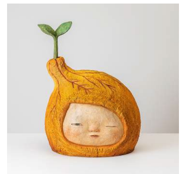
「sprouts of spring」 2022年 楠、油彩

楠に油絵具で彩色した作品を特徴としており、木という素材の中から、自身が求める形を探り当てるように彫り出していく。また、絵画と彫刻を横断的に取り組みながら、最近では、楠の板を使った平面作品へも精力的に取り組んでいる。国内外で継続して多くの作品を発表し、活躍の幅を広げている。近年の主な個展に「Like a Garden, Like a Home」（2023年ギャラリー椿）、「Like a Garden」（2023年銀座 蔦屋書店）、「before the dawn」（2022年銀座 蔦屋書店）、「our whereabouts - 私たちの行方 -」（2021年ポーラ ミュージアム アネックス）、「inside us」（2021年ギャラリー椿）、「GROWTH」（2020年華山 1914 文創産業園区）など。現在、神奈川県で10人のアーティストが入居するアトリエで制作を行う。 https://www.moe-nakamura.com/