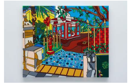
「Saint-Jean-de-Luz」 2024 年 Acrylic on Canvas