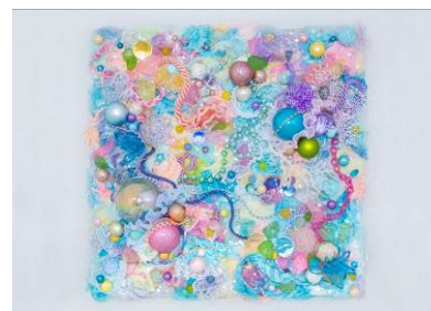
「TRUE COLORS -home-」 2013/2024年 和紙、シーグラス、 ガラスビーズ、ガーゼ、コットン生地