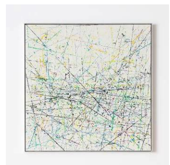
「landscape S010.006.2022」 2022年 油彩、キャンバス