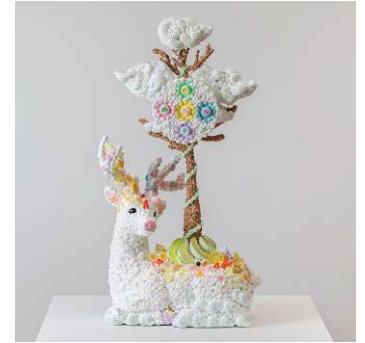
「春」2022 年 モデリングペースト、アクリル絵具、樹脂、FRP