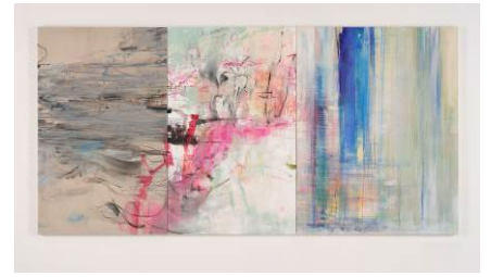
「View, 20 Pieces, 2020-21, No.02, May-Jun 2020」 2020年 キャンバスに顔料、アクリル、その他