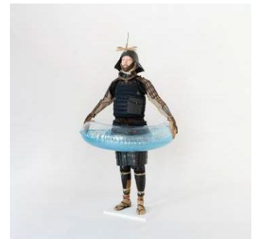
「RING AND MAN」 2024年 ミクストメディア

https://gyokuei.tokyo/photo/album/414837