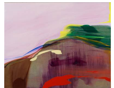
「頂より眺む The Scene I Once Saw」 2024年 油彩、キャンバス

日本の色彩文化のルーツを多角的に捉えながら、独自の色彩感覚で油彩表現の幅を拡張し続け、建築空間の色彩監修をはじめさまざまなジャンルとのコラボレーションやダンスパフォーマンスなど国内外で幅広く活動している。女子美術大学芸術学部絵画科洋画専攻卒。2002年文化庁新進芸術家在外研修員(アメリカ)、2004年ポーラ美術振興財団在外研修員(アメリカ・トルコ)。主な展覧会に「VOCA 展」上野の森美術館（2000年・2006年）、「絵画を抱きしめて」資生堂ギャラリー（2015年）、「高松コンテンポラリーアート・アニュアル vol.05『見えてる風景／見えない風景』」高松市美術館（2016年）「その光に色を見る Spectrum of Vivid Moments」ポーラ・ミュージアム・アネックス、高梁市成羽美術館（2022年）など。パブリックコレクションに高松市美術館、練馬区立美術館、Jordan Schnitzer Museum of Art(アメリカ)、University of Michigan Museum of Art(アメリカ)、Kocaeli University Museum (トルコ)など。 https://manikanagare.com/