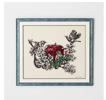
「apple blossom」 2022年 画用紙、アクリル

1975年 静岡県出身。多摩美術大学グラフィックデザイン専攻卒業。精緻な観察による描写のきめ細やかさと大胆な構図で、観る者を圧倒させるような生命力のある線の世界を描き出す切り絵アーティスト。中島美嘉の CD ジャケットアートワーク、Reebok とのコラボレーションスニーカーやユニクロ「UT」への参加、直木賞作家の桐野夏生氏、木内昇氏の小説への挿画や装丁、NHK 太宰治短編小説集「グッド・バイ」の映像制作、NHK 「猫のしっぽカエルの手」オープニングタイトル制作などがある。お能の宝生流家元主催の「和の会」メインビジュアル担当 (2008-2018)。福音館書店かがくのとも から絵本 2019年 7月号「むしたちのおとのせかい」、2022年 11月号「からまつ 一ふじさんにもりをつくるきー」を刊行。現在巡回展「サンリオ展 ニッポンのカワイイ文化 60年史?」に参加。2022年 巡回展「日本の切り絵 7人のミュージズ展」参加。2024年 小学校の図工の教科書「ずがこうさく 1.2 下「みつけたよ」(開隆堂出版)登場。その他、国内外の個展や合同展の参加、ワークショップなど多方面で活躍中。 http://risafukui.jp/