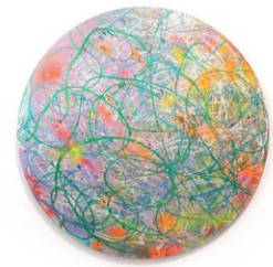
「cartwheel galaxy」 2022年 acrylic, glitter, glass, spray on canvas

https://mtkcontemporaryart.com/artist/kito-kengo/