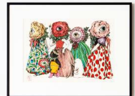
「はる」 2022年 手漉き和紙、水彩、ペン