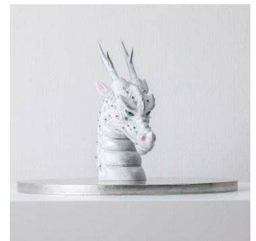
「再生の龍」 2023年 陶土、顔料