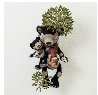
「Kissing under the mistletoe」2020年 ウール素材、化繊綿、ハードボードジョイント他 焼き物目玉(絵付け協力：ヒグチユウコ)