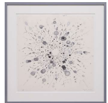
「Untitled (Lights) #25」 2024年 シルバーインク、青墨、竹和紙