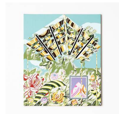
「暖かな晴天の日」 2022年 油彩、キャンバス

主な個展に「アトリエの景色」(2023年 新宿高島屋)、「Garden」(2023年 六本木ヒルズ A/D ギャラリー)、「みてもみきれない。」(2020年 ミヅアートギャラリー)、「思わず、たち止まざるをえない。」(2019年 ポーラ ミュージアム アネックス)等、主なグループ展に「異文化は共鳴するのか？ 大原コレクションでひらく近代への扉」(2024年 大原美術館)、「現代美術のポジション 2021-2022」(2021-2022年 名古屋市美術館)など。愛知県芸術文化選奨・新人賞(2022)、VOCA 奨励賞(2015)などを受賞。パブリックコレクションに大原美術館、愛知県美術館、パブリックアートに三菱地所、第一生命保険株式会社などがある。 https://www.rinamizuno.com/