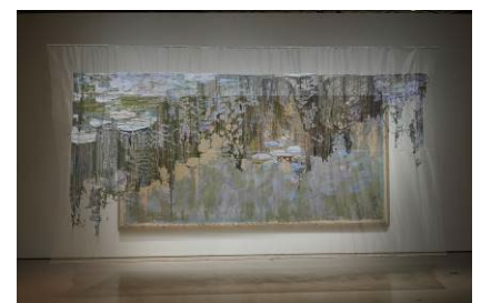
「修復された C.M.の1916年の睡蓮」 2023-2024年 糸糸、絹オーガンジー紙

https://www.takaishiigallery.com/jp/archives/4171/