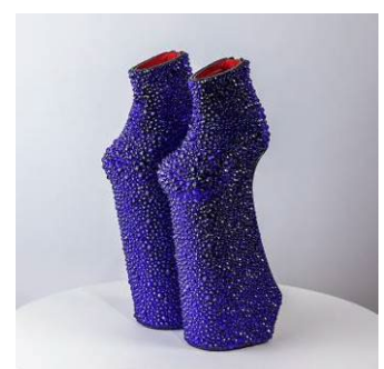
「Baby Heel-less Shoes」2021年 牛革、豚革、染料、クリスタルガラス、金属ファスナー