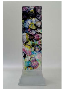
「新宿百景」2024年 ガラス