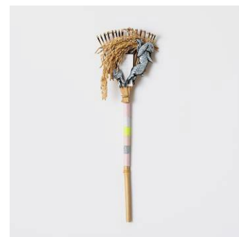
「跳ねる」 2022年 竹、陶、フェルト、稲穂

日本古来より現代に続く独自の感性を織り込んだ作品を制作。作品は絵画のみならず、インスタレーション、半立体、プロダクト、小説まで表現領域は多岐にわたる。主な展覧会に「白粉花 Little Lily - White Lie」(2013年 POLA MUSEUM ANNEX)、「天は自らを助くるものを助ける」(2013年 箱根ポーラ美術館)「変容する家」(2018年 金沢21世紀美術館)、「BOTANICA」(2018年 釜山市立美術館)、「アート&デザインの大茶会」(2018年 OPAM)、さいたま国際芸術祭 2020「蝴蝶の夢」(2020年)、「ことばのかたち かたちのことば」(2021年 神奈川県民ホールギャラリー)、「とある術館の夏休み」(2022年 千葉市美術館)、「クロヤギ シロヤギ通信展」(2023年 MtK Contemporary Art)、「Made in Shiga」(2024年 OMOTESANDO CROSSING PARK)など。最新の作品集は「反射 yin-yang」(2022年)。京都高島屋 S.C.T8 「(THISIS) NATURE」ディレクター。ARTISTS' FAIR KYOTO コミッショナー。 http://www.maimiyake.com/