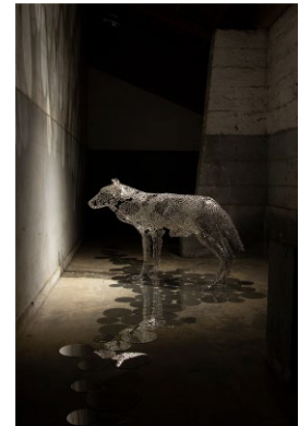
「真神 makami」 2021年 銅線