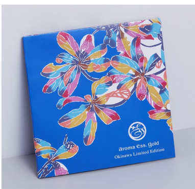
アロマエッセゴールド フェイスケア 4 点キット N Okinawa Limited Edition