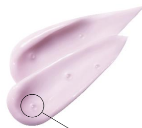
アーモンドオイルを 内包したカプセル

シंकエキスや、アーモンドオイルを内包したカプセルを密着クリームに閉じ込め、 毛穴*に絡みとどまるテクスチャーで 頭皮・髪の汚れを落とし、すこやかに保ちます。