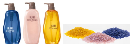
※アメニティの容器を粉砕し、リサイクルパズルに