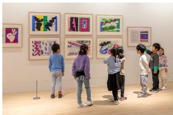
近隣の保育園の年長さんとのワークショップ

ポーラ ミュージアム アネックス(東京・中央区銀座)は、ポーラ銀座ビル 15 周年を記念し、ポーラ美術館が所蔵する 20 世紀を代表する画家の一人、アンリ・マティスの作品を展示した「マティス — 色彩を奏でる」展を 2024 年 10 月 4 日(金) から 27 日(日) まで開催しました。今年最多の来場者数を記録し、盛況のうちに幕を閉じました。