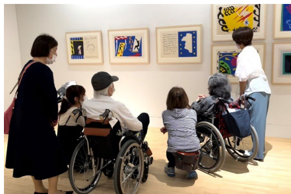
対話型鑑賞会の様子