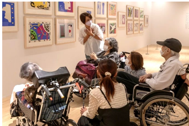
高齢者を対象にした対話型鑑賞会の様子