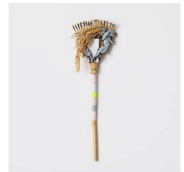
「跳ねる」 2022年 竹、陶、フェルト、稲穂

日本古来より現代に続く独自の感性を織り込んだ作品を制作。作品は絵画のみならず、インスタレーション、半立体、プロダクト、小説まで表現領域は多岐にわたる。主な展覧会に「白粉花 Little Lily - White Lie」(2013年 POLA MUSEUM ANNEX)、「天は自らを助くるものを助ける」(2013年 箱根ポーラ美術館)「変容する家」(2018年 金沢21世紀美術館)、「BOTANICA」(2018年 釜山市立美術館)、「アート&デザインの大茶会」(2018年 OPAM)、さいたま国際芸術祭 2020「蝴蝶の夢」(2020年)、「ことばのかたち かたちのことば」(2021年 神奈川県民ホールギャラリー)、「とある術館の夏休み」(2022年 千葉市美術館)、「クロヤギ シロヤギ通信展」(2023年 MtK Contemporary Art)、「Made in Shiga」(2024年 OMOTESANDO CROSSING PARK)など。最新の作品集は「反射 yin-yang」(2022年)。京都高島屋 S.C.T8 「(THISIS) NATURE」ディレクター。ARTISTS' FAIR KYOTO コミッショナー。 http://www.maimiyake.com/