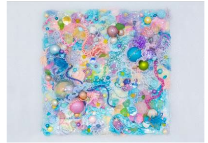
「TRUE COLORS -home-」 2013/2024年 和紙、シーグラス、 ガラスビーズ、ガーゼ、コットン生地