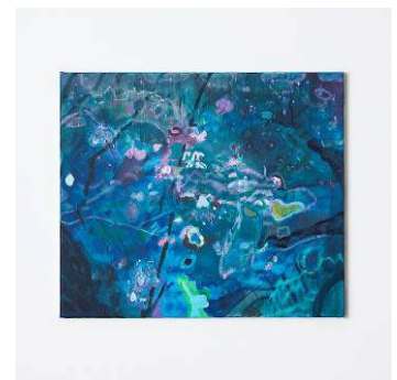
「とある」 2022年 油彩、アクリル、キャンバス

http://tomiokoyamagallery.com/artists/yuka-kashihara/