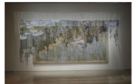
「修復された C.M.の1916年の睡蓮」 2023-2024年 糸糸、絹オーガンジー紙

https://www.takaishiigallery.com/jp/archives/4171/