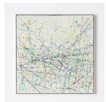
「landscape S010.006.2022」 2022年 油彩、キャンバス