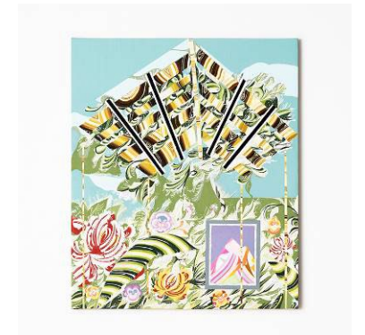
「暖かな晴天の日」 2022年 油彩、キャンバス

主な個展に「アトリエの景色」(2023年 新宿高島屋)、「Garden」(2023年 六本木ヒルズ A/D ギャラリー)、「みてもみきれない。」(2020年 ミヅアートギャラリー)、「思わず、たち止まざるをえない。」(2019年 ポーラ ミュージアム アネックス)等、主なグループ展に「異文化は共鳴するのか？ 大原コレクションでひらく近代への扉」(2024年 大原美術館)、「現代美術のポジション 2021-2022」(2021-2022年 名古屋市美術館)など。愛知県芸術文化選奨・新人賞(2022)、VOCA 奨励賞(2015)などを受賞。パブリックコレクションに大原美術館、愛知県美術館、パブリックアートに三菱地所、第一生命保険株式会社などがある。 https://www.rinamizuno.com/