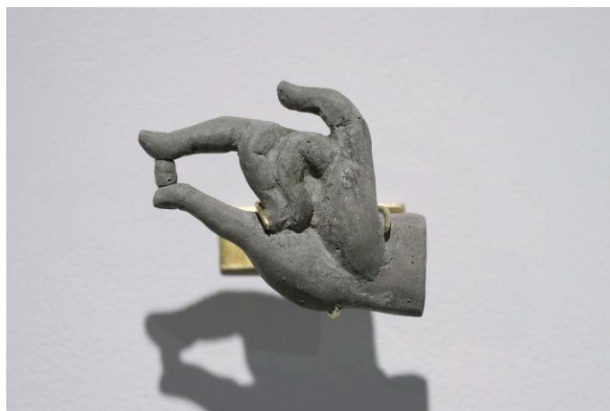
右：「Street Amulets - Hand / ストリートアミュレット 手」2022年 60×70mm セメント、真鍮