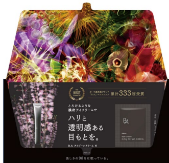
開封時のインパクトで「B.A」ブランドの世界観をお伝えする仕掛け。

漆黒の封筒を開封すると華やかなアートワークが現れる仕様を採用し、「B.A」ブランドの世界観を表現。ブランド間のクロスセルも狙った。また、成功したF2転換施策のノウハウを生かし、レビューや使用方法の情報を掲載したり、二次元コードからDMを受け取った方限定のLPへ誘導。より詳細な情報へのアクセスと購入動線を構築した。