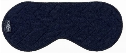
オルガヘキサ キルトパッド