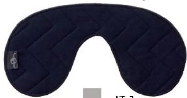
オルガヘキサ キルトパッド