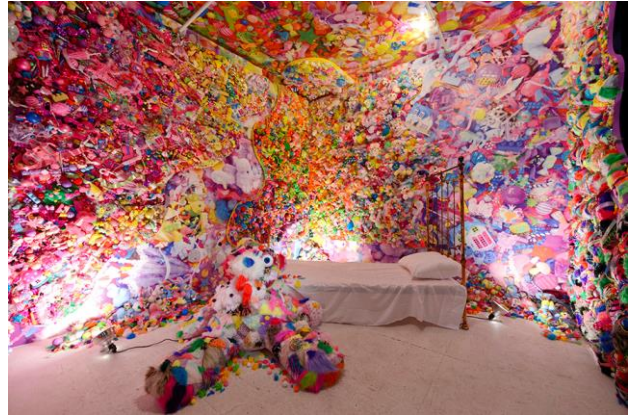
2014 Colorful Rebellion -Seventh Nightmare- ニューヨーク