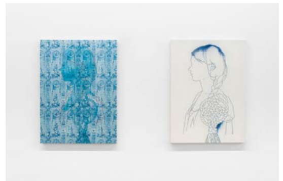
左: 「portrait-Diana and Venus」2011年 染料, 蠟による防染, インクジェットプリント, シルクサテン 右: 「portrait-Blue」2011年 染料, 蠟による防染, シルクサテン