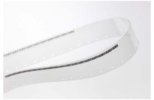
<爆心地・8/6・犬の散歩>に基づく音楽のための アニメーション 5分 2015年 16mmフィルム、16mm映写機、スピーカー、写真