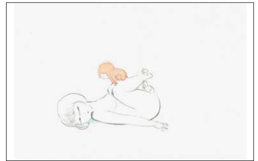
「KiyaKiya_sketch_2009_2」2009年 紙に鉛筆、水彩絵の具

2006年 個展「てんとう虫のおとむらい」ミヅマアートギャラリー（東京） 2007年 個展「hint」Taché-Lévy Gallery（ベルギー、ブリュッセル） 「Contemporary Outlook: Japan」Museum of Fine Arts, Boston（アメリカ、ボストン） 「Thermocline of Art—New Asian Waves」ZKM（ドイツ、カールスルーエ） 2008年 個展「果肉」ミヅマアートギャラリー（東京） 2010年 「DOMANI・明日展 2010」国立新美術館（東京） 「YouTube Play: Biennale of Creative Video」グッゲンハイム美術館（アメリカ、ニューヨーク） 2011年 個展「KiyaKiya」ミヅマアートギャラリー（東京） 2012年 「Planete Manga! (at Studio 13/16)」Centre Pompidou（フランス、パリ） 2013年 個展「KiyaKiya 1/15 秒」galleri s.e（ノルウェー、ベルゲン） 2014年 「ゴー・ビトゥイーンズ展：こどもを通して見る世界」森美術館（東京）他3会場へ巡回 URL: http://akinokondoh.com/