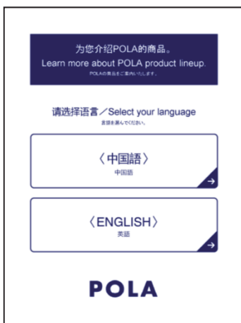
言語選択画面（中国語・英語）