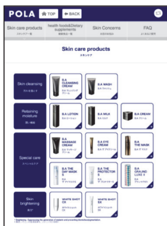
B.A、ホワイトショット商品画面