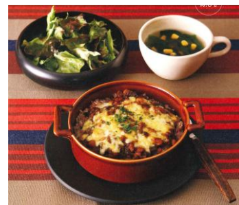
ポーラ×グリーンハウス 「焼きカレードリア定食」

仕様：B5判・並製 定価：1,143円（税別） レシピ作成：（株）グリーンハウス 発行：（株）ワニブックス