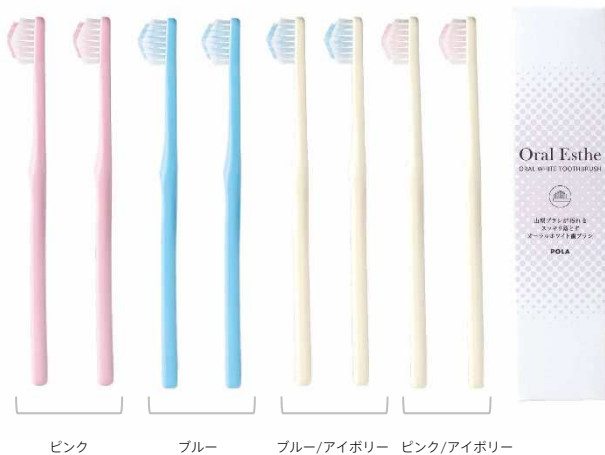
ピンク ブルー ブルー/アイボリー ピンク/アイボリー

全国のポーラレディ、コスメ&エステショップ「ポーラ ザ ビューティ」約620店を含む、全国約4800店のポーラのお店でカタログ販売にてお取り扱いします。百貨店でのお取扱いはございません。