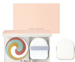
カラーブレンド グローファンデーションN (パフ付き) リフィル ¥5,830 (税抜¥5,300)