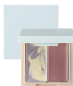
カラーブレンドグローアイカラー ¥3,300 (税抜¥3,000)