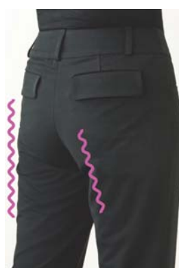
一般的なショーツ着用