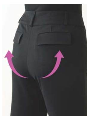
ビューティヒップライナー着用

ヒップがナチュラルにアップ。太もも周りもすっきり。ラインがアウターにひびかず、美しいヒップラインを実現。