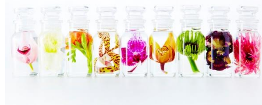
※フラワーオーキッドボトル イメージ