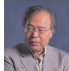
荒俣 宏さん (博物学者、小説家、翻訳家)

文化的で安定した暮らしが1万年以上続いた縄文時代。対して、テクノロジーの進化で、AI（人工知能）やAL（人工生命）、BT(バイオテクノロジー)など、見慣れぬ言葉が増え続け、目まぐるしく変化する現代。これから我々はどこに向かうのか。縄文時代と近未来を考えるとから見えるものとは？ポラ企業文化誌『WE／』5・6月号で、熱く「縄文×近未来」について語っていただいた荒俣 宏さんと井浦 新さん。冊子には掲載しきれなかった内容を、今回はトークショーにて語っていただきます。縄文と近未来をかけあわせることでどのような「かなでる」が展開されるのか、ぜひご期待ください。