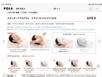
（エステメニュー画面イメージ）

ポーラの肌分析に基づいて、3種類からおすすめのエステメニューをご提案します。APEXスキンケアと共通の保湿成分を配合したエッセンスやマスクを使用。