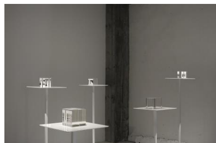
上: 「ひとつになる世界 / 金環日蝕」 Annular Solar eclipse - Series of "It's One World" (2018) 下: 「ひとつになる世界」シリーズ Series of "It's One World" (2015)